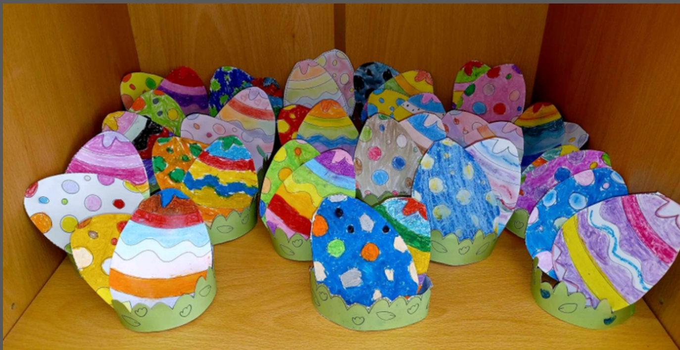
Pisanki wykonane przez uczniów z klasy 1c

O których obrzędach i zwyczajach pamiętamy w Wielkanoc i kultywujemy je od lat? Wielkanoc to najstarsze i najważniejsze święto w religii chrześcijańskiej. Ten radosny czas obfituje w wiele zwyczajów. Większość z nich znane jest od średniowiecza i praktykowane do dziś.