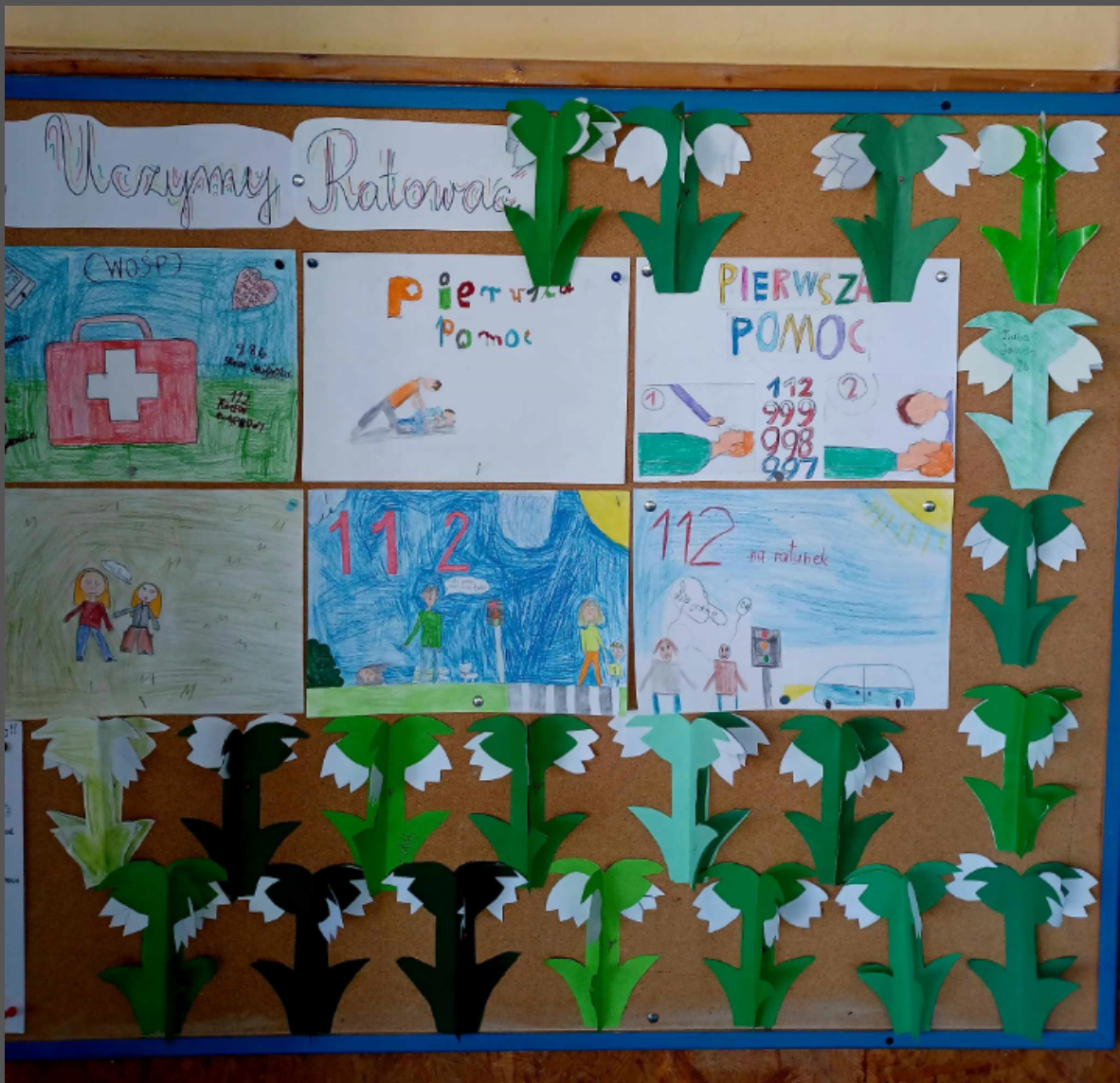
przebiśniegi wykonane przez uczniów klasy 2b