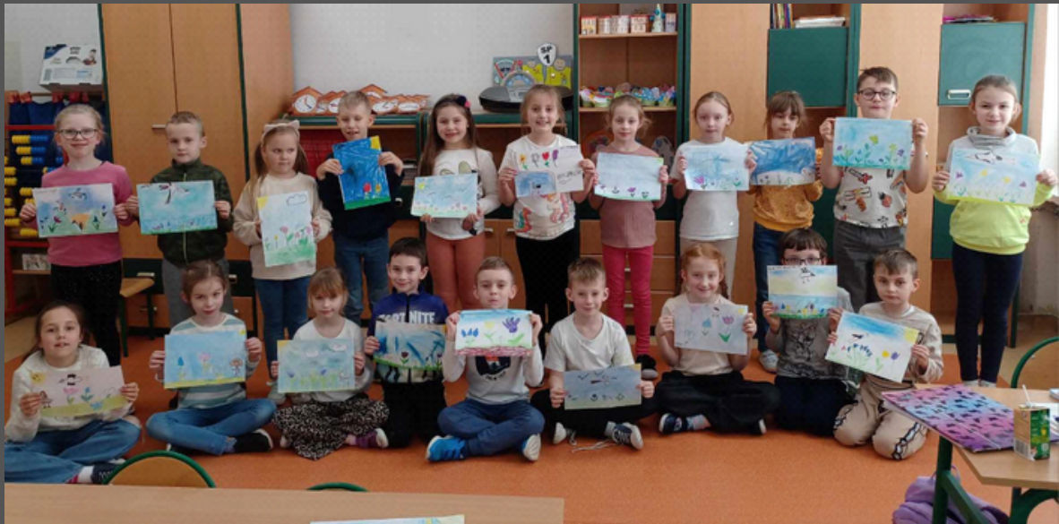
uczniowie klasy 1c i ich prace o wiosnie