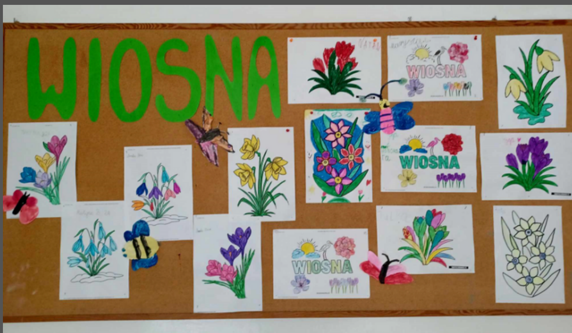
wiosenne prace wykonane podczas zajęć plastycznych na świetlicy szkolnej

Data na którą większość uczniów czeka z niecierpliwością to 21 marca, czyli tzw. kalendarzowy, pierwszy dzień wiosny. Początek wiosny astronomicznej – a dokładnie równonocy wiosennej – przypadnie w tym roku dzień wcześniej, czyli 20 marca.